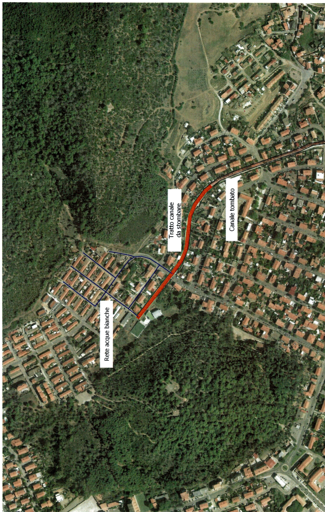
In blu la rete delle acque bianche – in rosso il tratto di canale tombato oggetto d'intervento