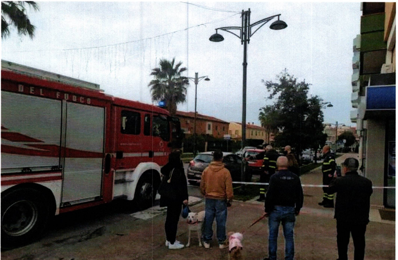
L'intervento dei vigili del fuoco

L'animale si è salvato grazie al pronto intervento della padrona che ha tirato il guinzaglio, allontanandolo dal pericolo